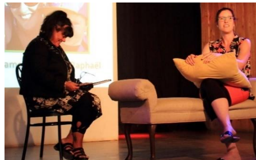
Assemblée générale annuelle 13 juin 2019, Seigneurie des Patriotes, L'Assomption