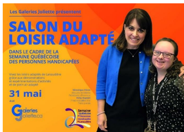
Salon du loisir adapté 31 mai 2019, Galeries Joliette

L'édition 2019 aura été des plus marquantes avec l'organisation du tout premier Salon du loisir adapté ! C'est en présence d'élus, de représentants d'organismes d'action communautaire et de nombreuses personnes vivant avec un handicap, que l'Association régionale de loisirs pour personnes handicapées de Lanaudière (ARLPHL) et ses partenaires ont fait le lancement de cette importante journée de sensibilisation. Lors de cette journée, les visiteurs ont pu en apprendre davantage sur ce qui se faisait en matière de loisir adapté dans la région. Plus d'une dizaine d'organismes et d'intervenants étaient sur place afin de divulguer de l'information.