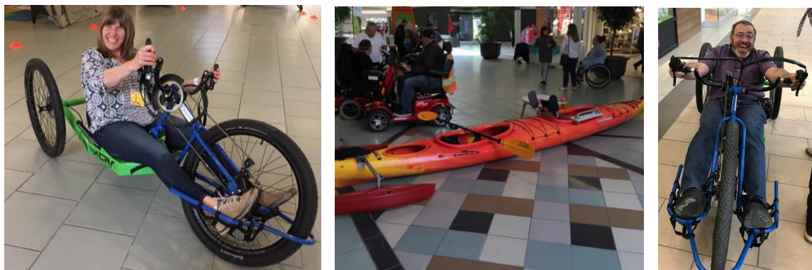
Grande tournée de plein air accessible 31 mai 2019, Galeries Joliette

Nous avons été très heureux d'accueillir la Grande tournée de plein air accessible de l'AQLPH dans notre région le 31 mai 2019 lors du tout premier Salon du loisir adapté. Pour l'occasion, plusieurs équipements de sport et de plein air adapté étaient présentés et les visiteurs pouvaient faire l'essai de certains items. Une initiative fort intéressante que nous souhaitons reproduire assurément.