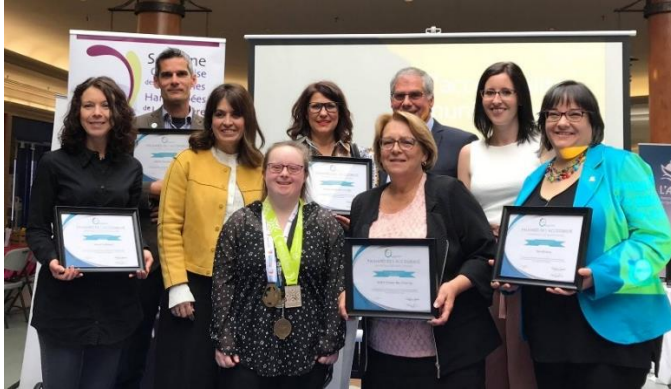
Palmarès des édifices municipaux accessibles 31 mai 2019, Galeries Joliette

Municipalités de 15 000 habitants et plus : Terrebonne