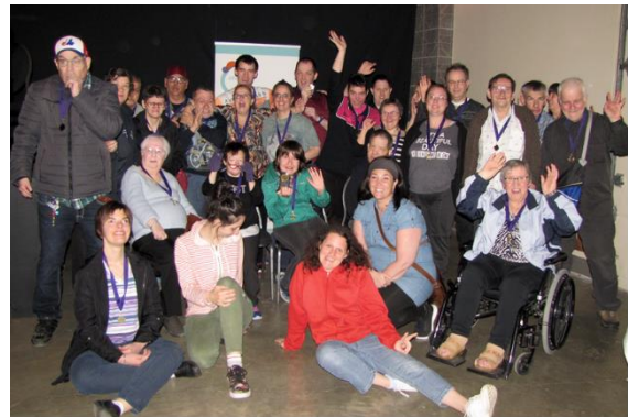
Événement 25 e anniversaire 15 mai 2019, Jolodium à Notre-Dame-des-Prairies